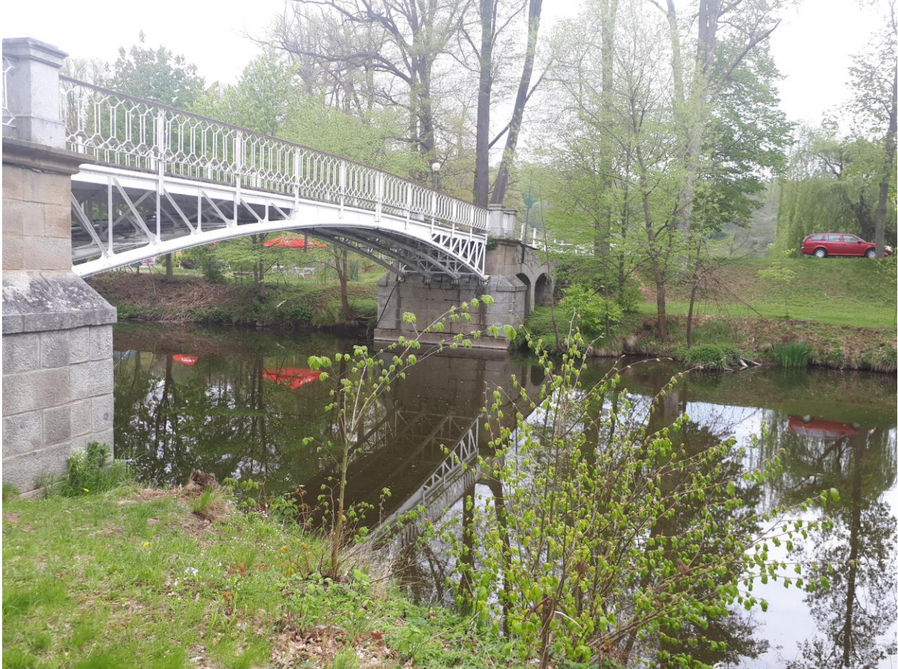
Situační fotografie z místa odběru

Příloha 2 Seznam účastníků školení (přivezou vzorkaři sebou)