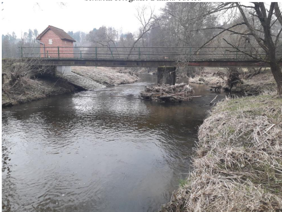
Situační fotografie z místa odběru